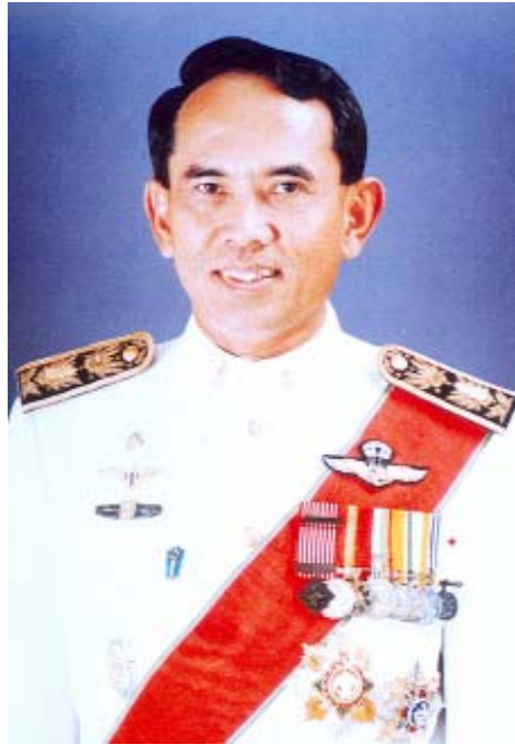
นายพล บุติธรรมดำรง อัยการสูงสุด

แนวนโยบายบริหารราชการด้านการคุ้มครองสิทธิ และช่วยเหลือทางกฎหมายแก่คนไทยในต่างประเทศ